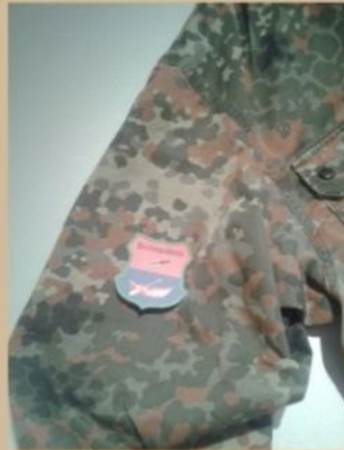
rechter Arm unter Flagge