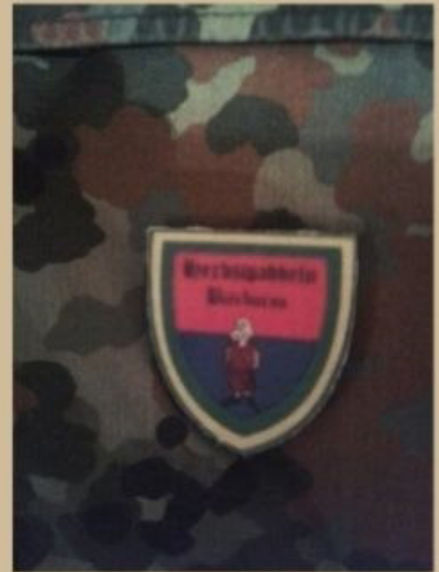
linke Brusttasche Mitte