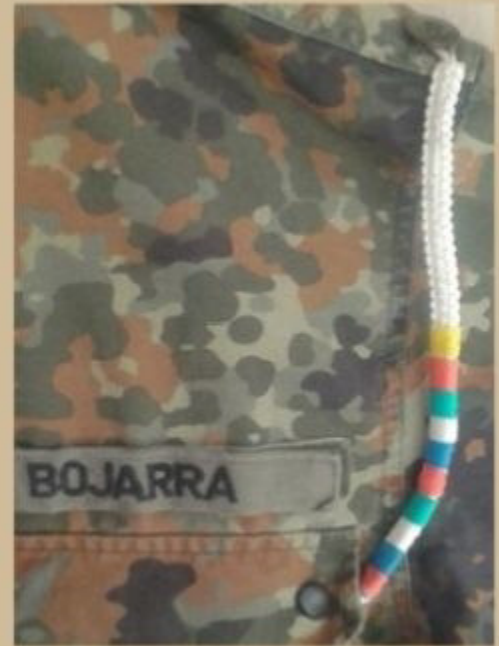
linke Schulterklappe bis Tasche