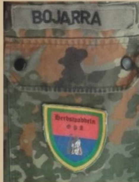
linke Brusttasche Mitte