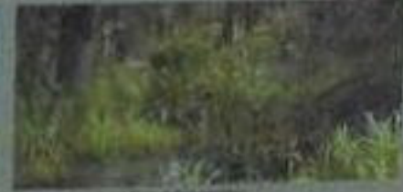
„Amazonas des Nordens“ und Biber-Schwärze