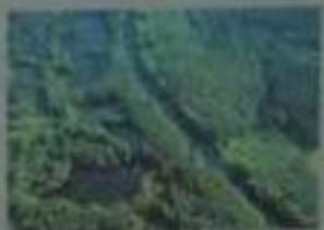
„Amazonas des Nordens“